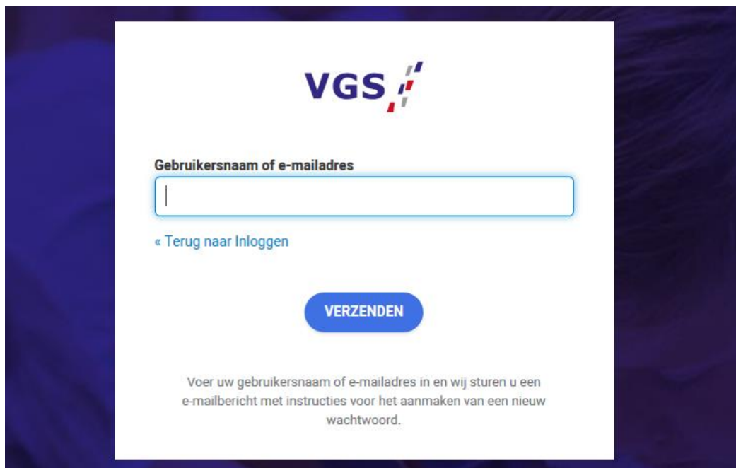
Afbeelding 3: wachtwoord vergeten

U ziet nu een ander scherm met een veld waar u uw gebruikersnaam of e-mailadres kunt invullen. Zie afbeelding 3. Vul deze in en klik op de knop Verzenden. U ontvangt binnen enkele minuten een e-mail met daarin verdere instructies.